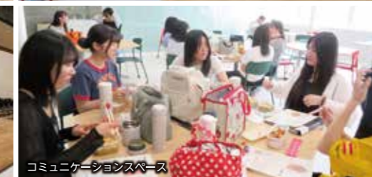
コミュニケーションスペース