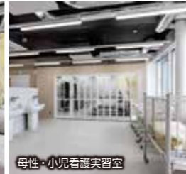
母性・小児看護実習室