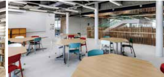
コミュニケーションスペース