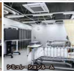
シミュレーションルーム